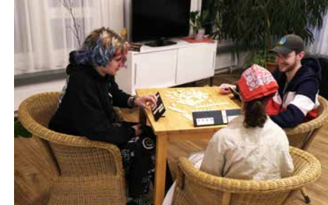
Eine Runde Rummy, oder ein anderes Spiel, bringt auf andere Gedanken.