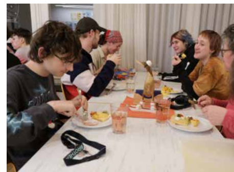
Das gemeinsame Abendessen im SEEGARTEN ist ein schöner Moment des Zusammenkommens, bei dem der Tag besprochen werden kann.