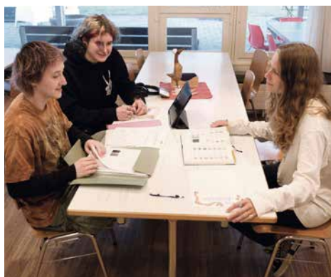
Am Hausaufgaben-Abend steht die Betreuung zur Unterstützung bereit.

Den SEEGARTEN machen tragfähige Beziehungen, klare Strukturen und die einmalige Lage zu einem besonderen Ort.