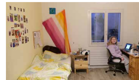
Das eigene Zimmer ist ein Raum zum Wohlfühlen und Entspannen nach einem langen Tag.

ihrer Freizeit können die Jugendlichen ihre Hobbys pflegen, neue Interessen entdecken und an verschiedenen Aktivitäten teilnehmen, die das Zusammengehörigkeitsgefühl stärken: ob bei einem gemeinsamen Filmabend, beim Kochen und Backen, oder bei Freizeitaktivitäten wie Billard, Volleyball und Tischtennis. So wird der Alltag im SEEGARTEN lebendig – ein Ort, der den Jugendlichen hilft, ihre Zukunft zu gestalten und gleichzeitig ein starkes Gemeinschaftsgefühl zu entwickeln.