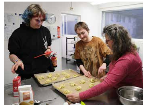
Der WG-Abend ist eine schöne Gelegenheit, um gemeinsam zu kochen, zu backen und den Abend zu genießen.

Direkt am Brienersee in Bönigen bei Interlaken gelegen, bieten die gut ausgestatteten Räumlichkeiten Platz für 22 Jugendliche. In