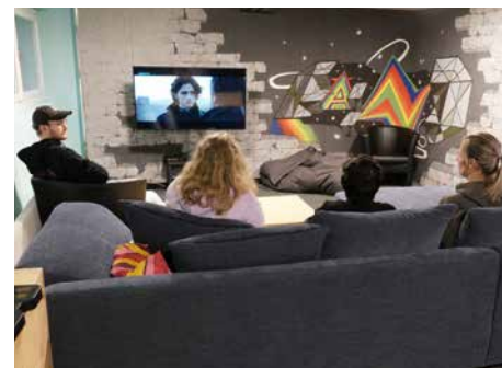
Beim gemeinsamen Filmabend kann man den Tag gemütlich ausklingen lassen.